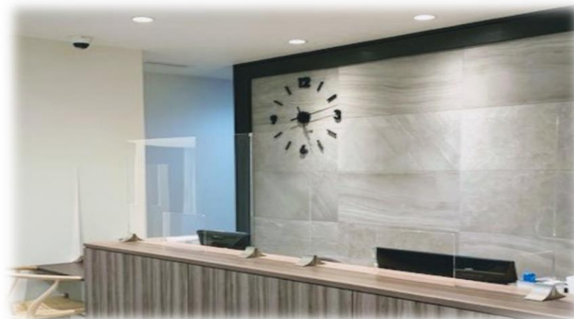
愛知県クリニック様 (受付)