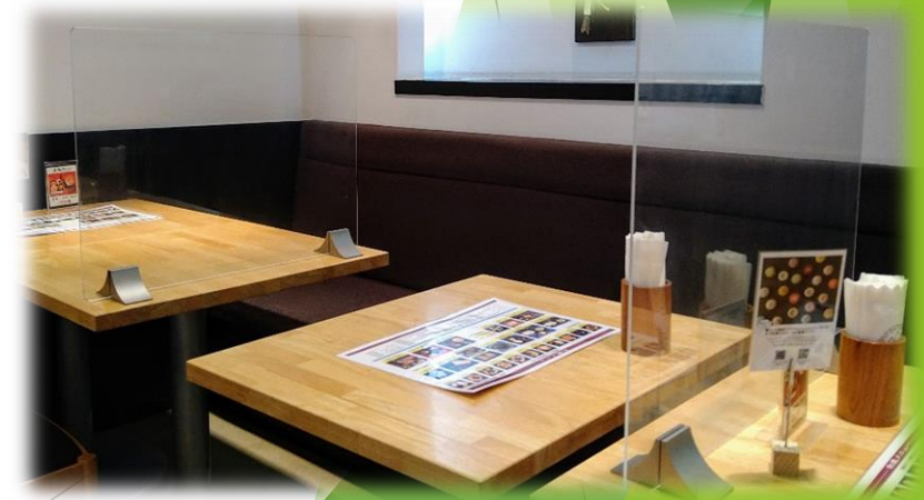
都内飲食店様 (喫茶スペース)