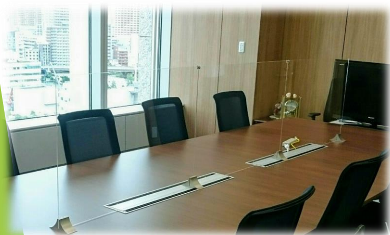
都内企業様 (役員応接室)

使い勝手の良さに加え、意匠性と安定性を評価していただき、お陰様で累計販売750個を達成し、これまでに全国30都府県へ納入いたしました。